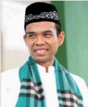
Ust. Abdul Somad