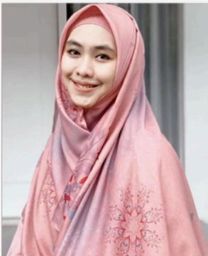
Ustazah Oki Setiana Dewi