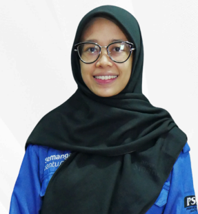
Sholativa, S.E CRM & Pelaporan